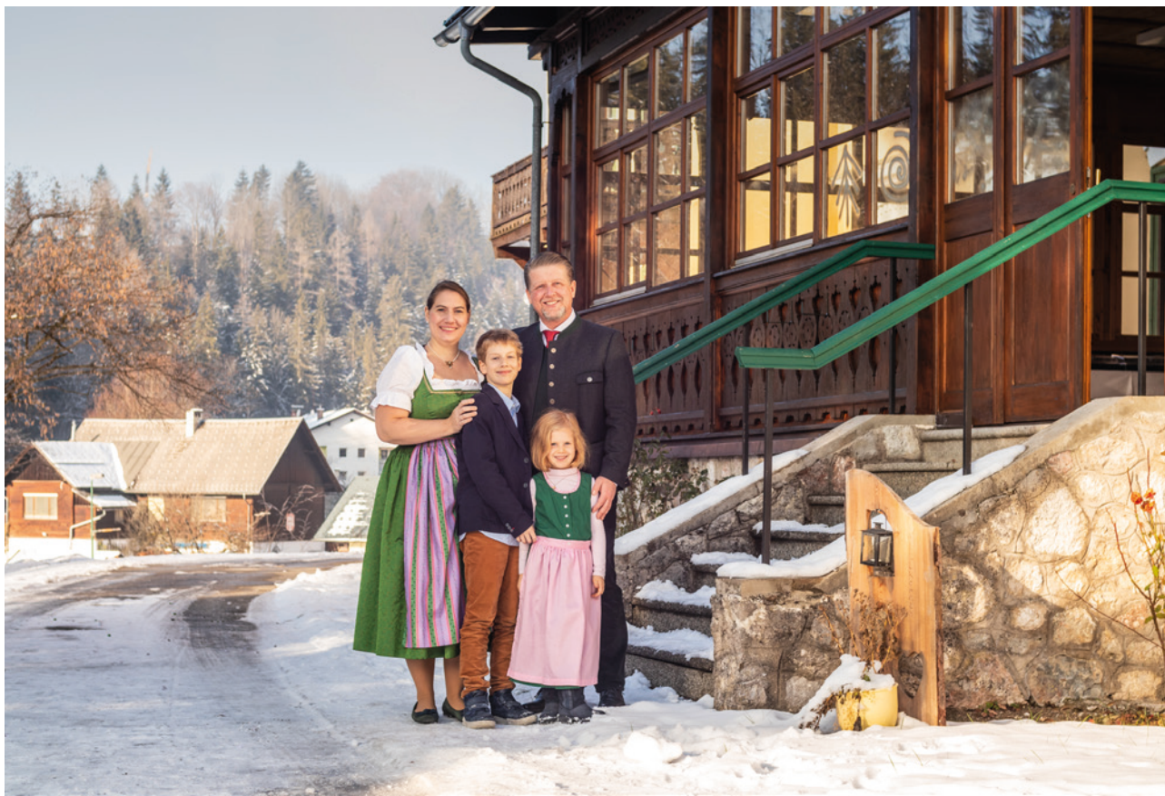
Die Beginne in Bad Aussee.