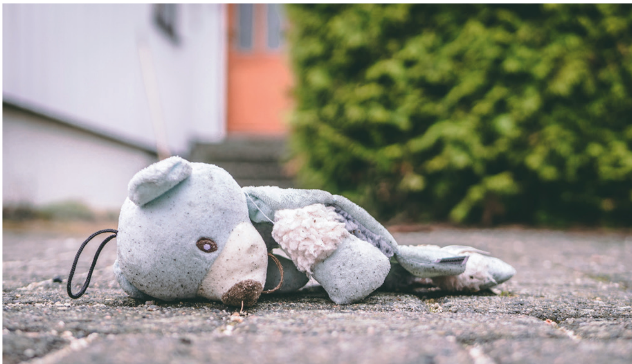
Streit auf dem Rücken der Kinder.