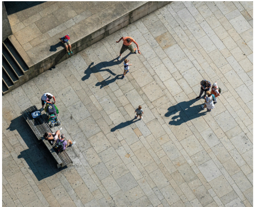
Die Gesellschaft und damit die Rollenbilder haben sich verändert.

So spannend an dieser Zeit ist, dass neue Wirklichkeiten nicht bedeuten, dass bewährte Modelle verschwinden. Vielmehr wächst das Bewusstsein, dass Familie, unabhängig von ihrer Form, ein Ort der Stärkung und gegenseitigen Verantwortung sein sollte. Nicht aus Tradition, sondern aus Einsicht