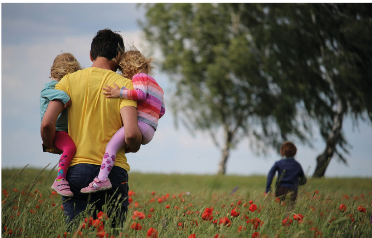
Familie bleibt ein zentraler Wert – auch in neuen Formen.