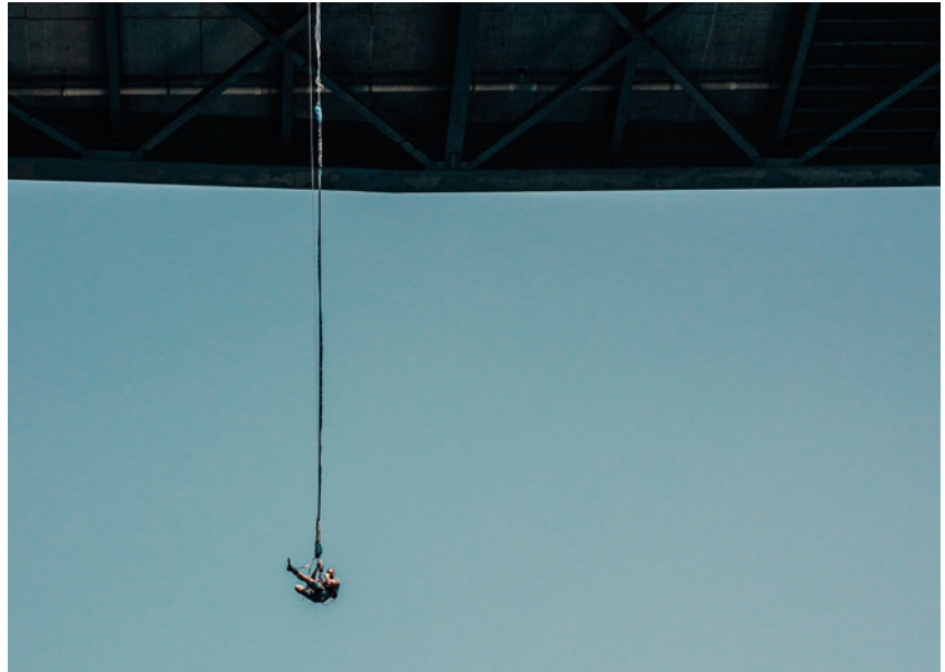
Auf der Bucket-List: Bungeejumping und Fallschirmspringen.

Für die Zukunft bei der Verbindung habe ich mir noch nicht solche