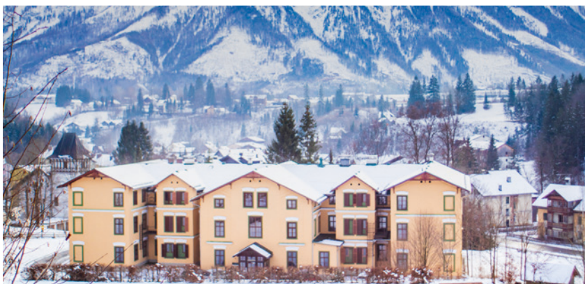
Gasthof Elisabeth nach dem Umbau.

Eine Liebesgeschichte über zwei Jahrzehnte: vom ersten Fettnäpfchen bis zur Ehe, zwei Kindern und einem Neubeginn in Bad Aussee. Trotz Corona, Unsicherheiten und 300 Kilometern Distanz halten Humor, Vertrauen und Gespräche unsere Familie zusammen.