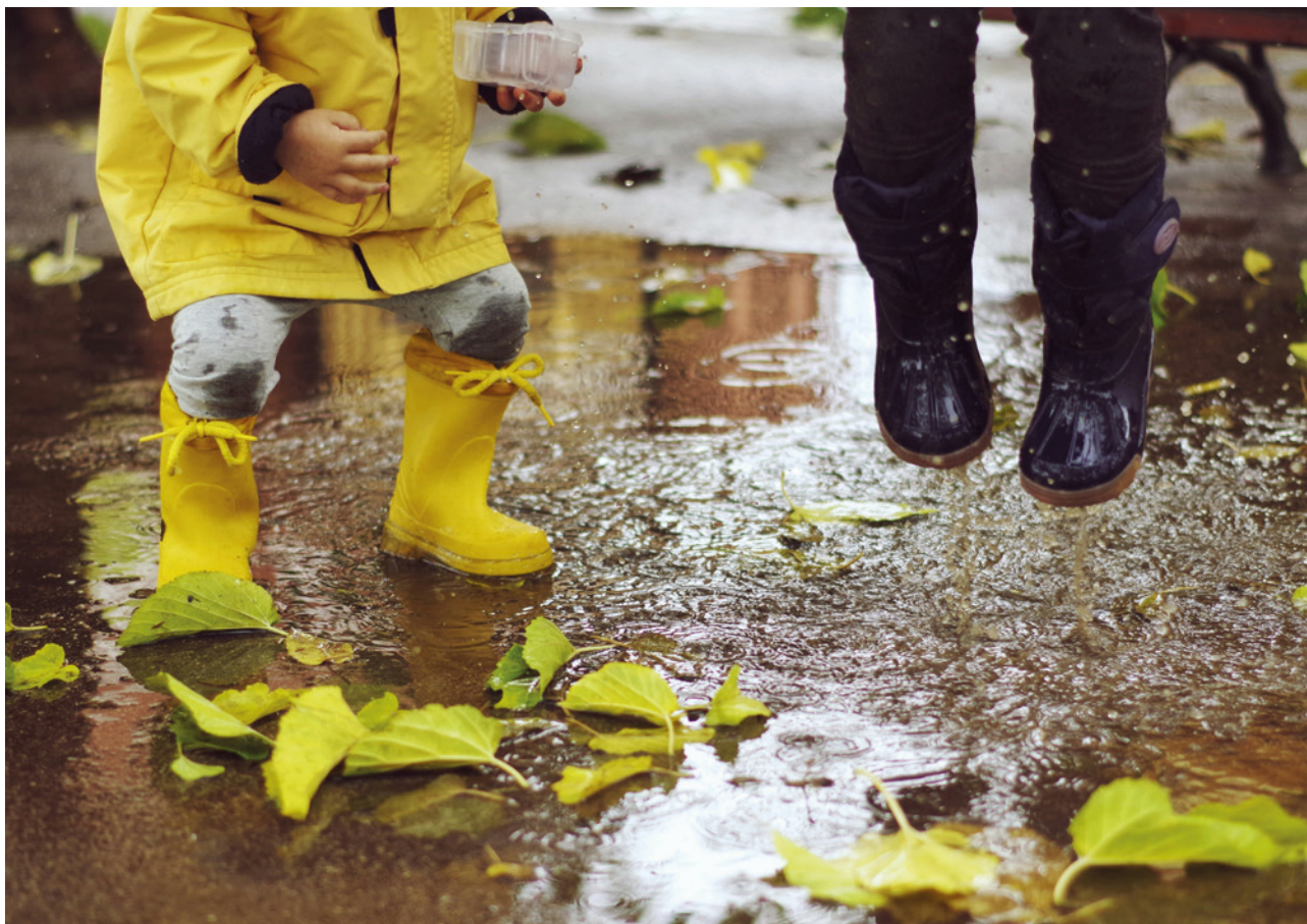
Das Talent der Kinder, Pläne zu pulverisieren.

Bier, genießt ein bisschen Ruhe. Mit Kindern? Vergiss es.