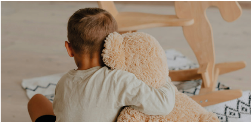
Emotionale Abschiede, die sich wiederholen.

Ein gängiges Klischee in Österreich lautet, dass bei Scheidungen Frauen die Opfer und Männer ohnehin froh darüber wären, die Last der Kindererziehung nicht mehr tragen zu müssen. Das ist aber nur die halbe Wahrheit. Die Trennung der Kinder von ihren Vätern verursacht dramatische und traumatische Schmerzen.