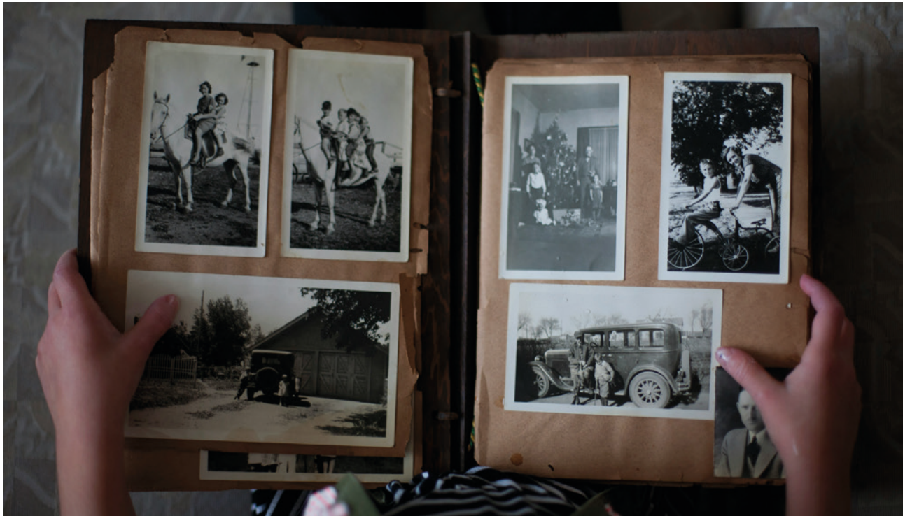
Vom Esstisch zur Wohnküche - wie sich das Familienbild im Raum verändert hat.